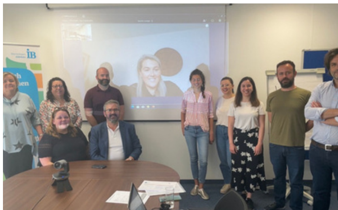
IB, Drezno, Niemcy, Maj 2022.