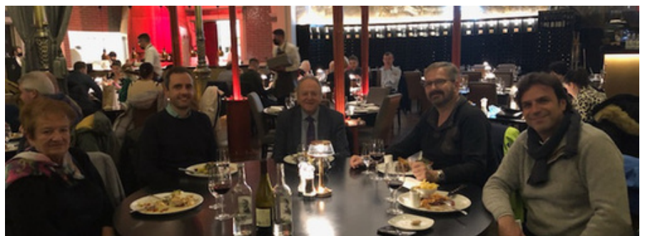
Dublin, Irlandia, Grudzień 2021.