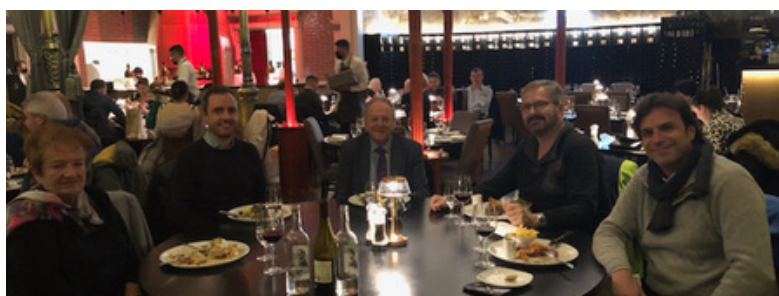
Δουλίνο, Ιρλανδία, Δεκέμβριος 2021

Από το τελευταίο ενημερωτικό δελτίο, και οι οκτώ εταίροι, από τις επτά ευρωπαϊκές χώρες, είχαν την ευκαιρία να συναντηθούν προσωπικά στο Δουβλίνο της Ιρλανδίας, όπου φιλοξενήθηκε από το Συμβούλιο Εκπαίδευσης και Κατάρτισης του Δουβλίνου (CDETΒ) τον περασμένο Δεκέμβριο καθώς και στη Δρέσδη της Γερμανίας για τις Διακρατικές Συναντήσεις του έργου.