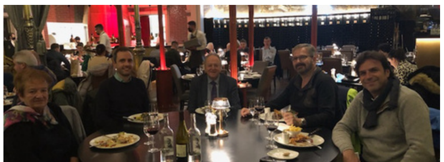
Dublin, Irland, Dezember 2021.