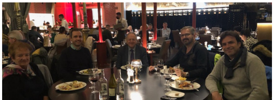
Dublín, Irlanda, Diciembre 2021.